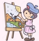
RACÓ DE DIBUIX